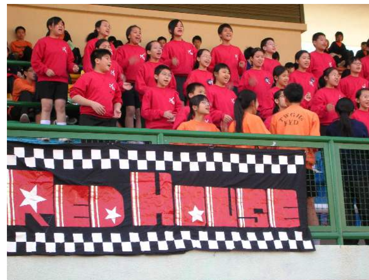
陸運會勤社啦啦隊