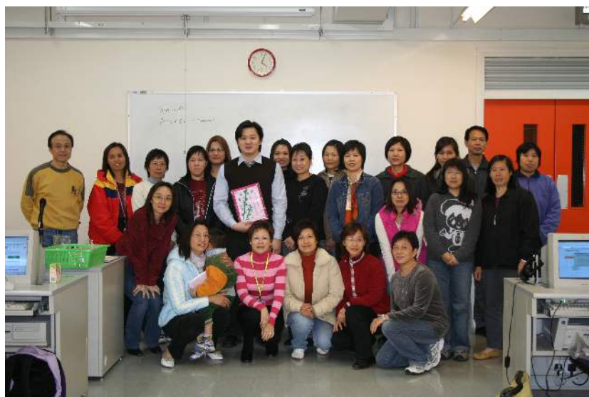
電腦班導師與家長合照