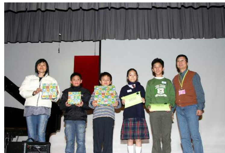
聖誕聯歡會幸運大抽獎