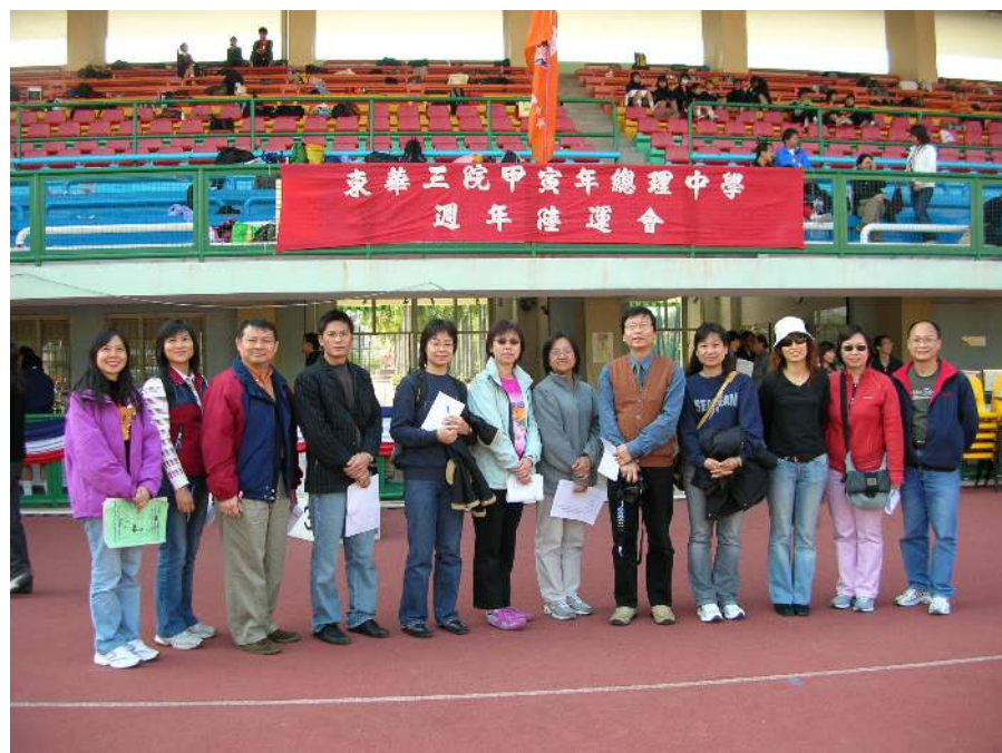
家長擔任陸運會啦啦隊評判