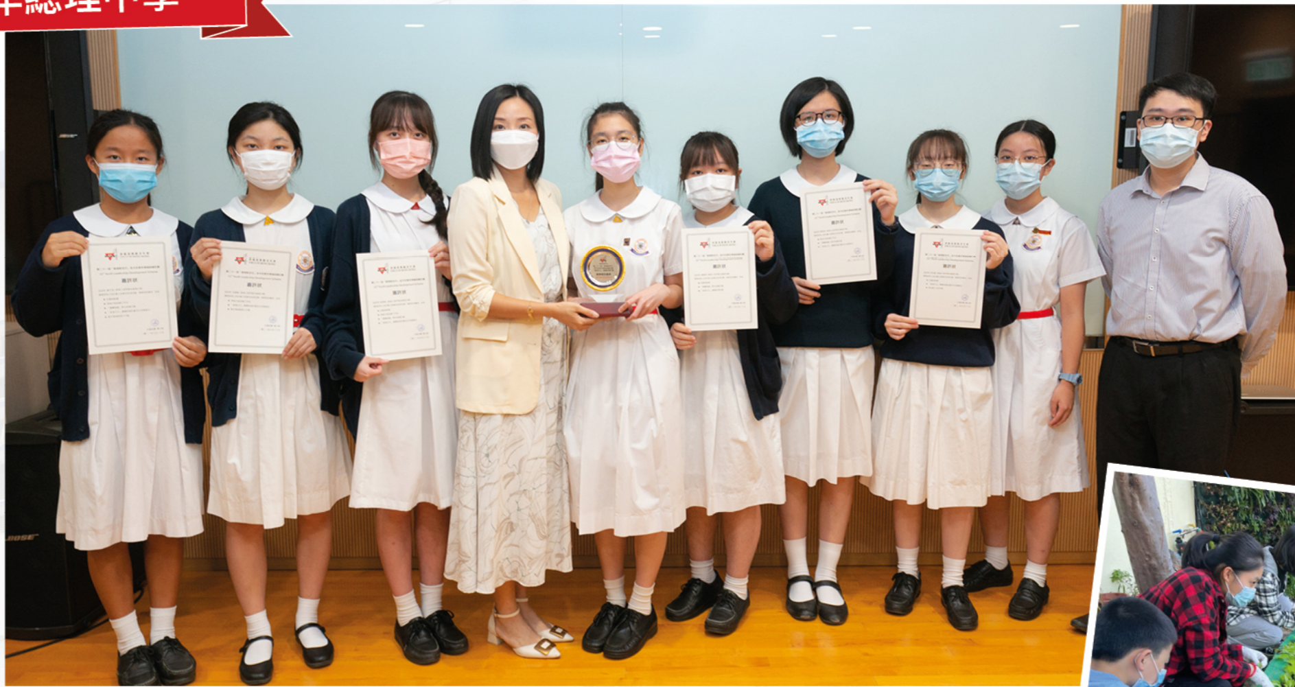
「傲翔新世代全方位青年領袖訓練計劃」專題研習比賽獲獎。

除了在認知層面上啟發學生關懷社會，學校更鼓勵學生身體力行參與社會服務。甲寅義工隊是學校的標誌性組織，同學透過探訪清潔工、獨居長者、教授和諧粉彩、協助老友記剪髮及營運 CAFÉ 等活動，提升與社區的連結，延展助人助己的精神，回饋社會。