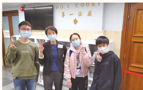
Chamber Debate Course.

與此同時，學校為中一新生提供完善的銜接支援，通過互相配合的課程和活動，讓學生能夠適應全英語的學習氛圍，對語文無所畏懼，一同成長。教學團隊開設為期一星期的中一銜接課程 (Bridging Course)，以及中二暑假課程 (Summer Course) 予準中一級及中二級學生。在課堂中，教師除了教授日常英文用語，亦會帶領學生預習課本，從而建立對學習內容的基本概念。不僅如此，外籍英語老師更會組織校外參觀考察活動，帶領學生到香港的不同地方，如大館、太平山頂等，通過與外籍人士交流實踐所學。